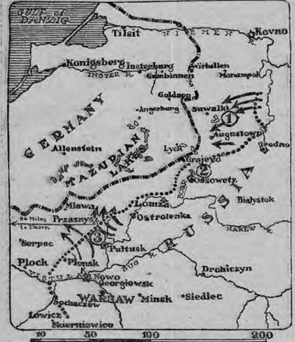
DIBUJO MILITAR QUE MUESTRA LA NUEVA OFENSIVA DE LOS RUSOS CONTRA LOS ALEMANES

Este dibujo militar muestra la nueva ofensiva de los rusos que, según informes de Petrogrado ha dividido en dos partes la campaña en la Polonia septentrional.