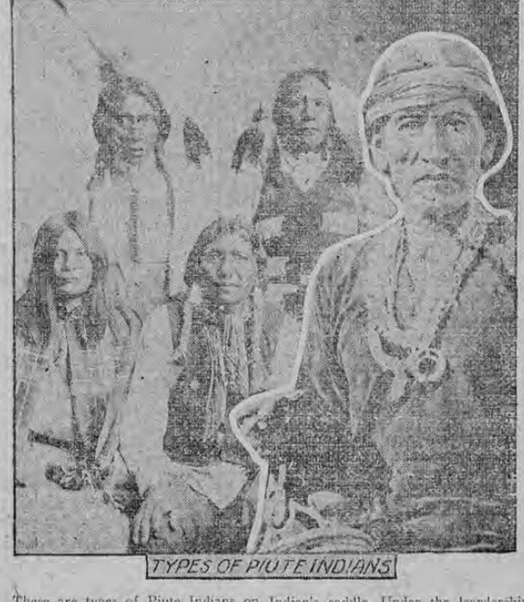
TYPES OF PIUTE INDIANS